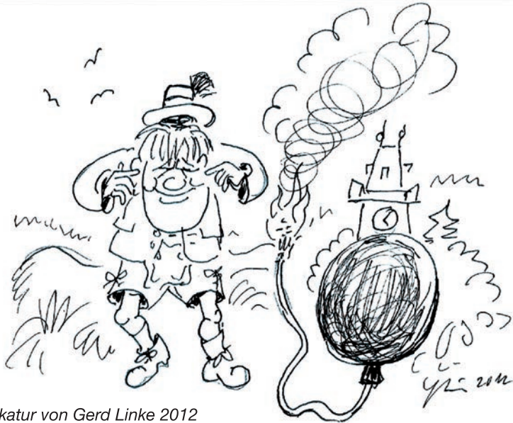
Karikatur von Gerd Linke 2012